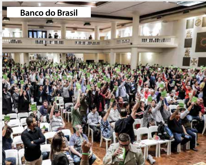
Banco do Brasil